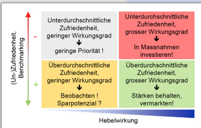
Portfolio mit Gewichtung aller Fragen